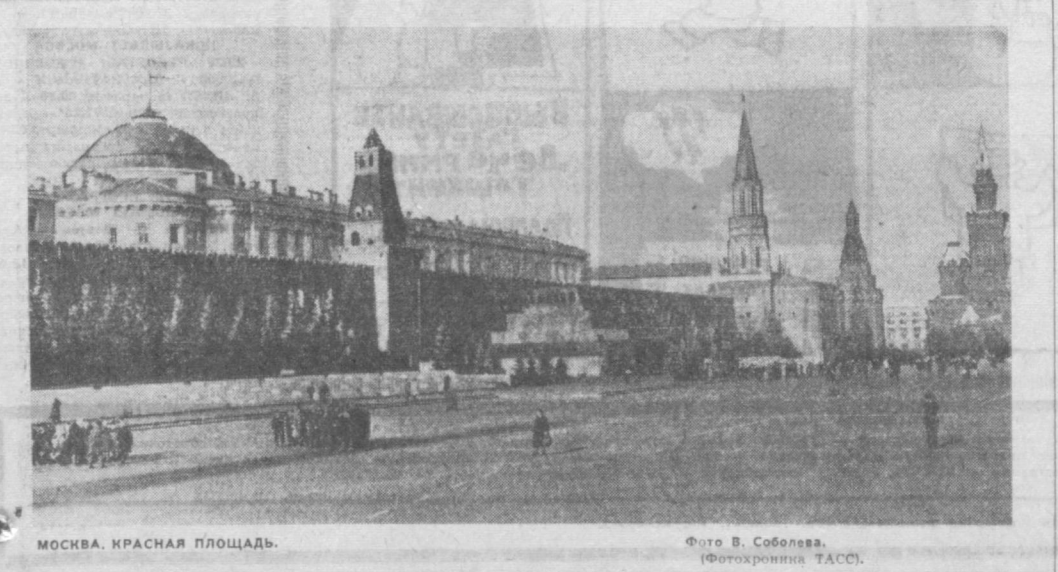
МОСКВА. КРАСНАЯ ПЛОЩАДЬ.