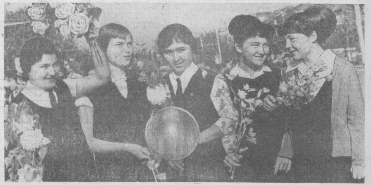
ЗАВТРА — НА ДЕМОНСТРАЦИЮ

коллективу строитреста № 159 Главташкентстроя в торжественной обстановке вручено переходящее Красное знамя Совета Министров республики и Узсовпрофа. Знамя присуждено по итогам социалистического соревнования между строительными организациями за истекший квартал. Более 10 тысяч квадратных метров жилой площади ввели строители передового треста за прошлые три месяца. С начала года коллектив соорудил и сдал в эксплуатацию вторую очередь керамзитового завода, 5 школ, два детсада (на жидмассиве Бешкайрагач и ул. Шахматовой). С неплохими показателями в труде встречают праздник Октября и другие коллективы строителей. Только за 9 месяцев Главташкентстроя сдал в эксплуатацию 232 тысячи квадратных метров жилья, 9 школ на 6.496 мест, 7 детсадов, 2 больницы, одну поликлинику и другие объекты.