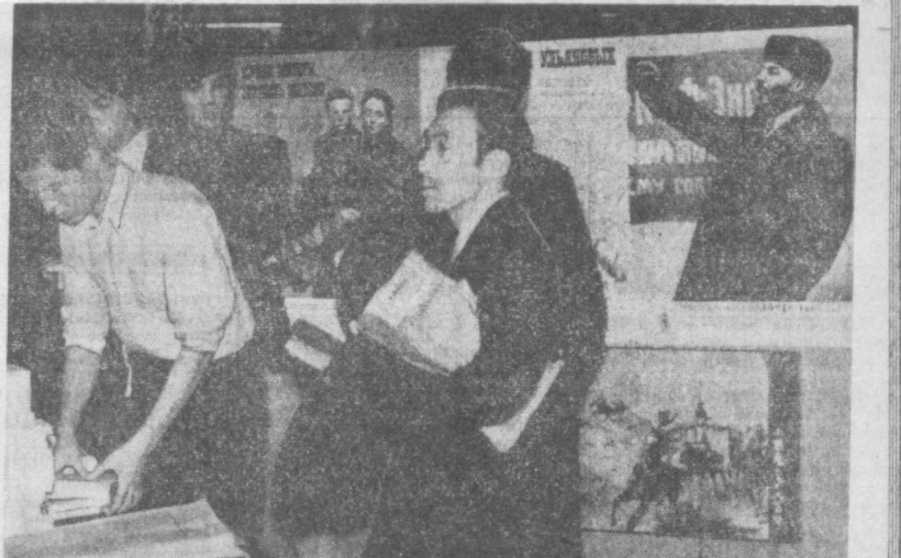
ЯПОНИЯ. В ЦЕНТРЕ ТОКИО В ЗАЛЕ «ОАКИЯ ХОЛЛ» БЫЛА ОРГАНИЗОВАНА ВЫСТАВКА «ОБРАЗ В. И. ЛЕНИНА В СОВЕТСКОЙ КИНОМАТОГРАФИИ». ПОСЕТИТЕЛИ ВЫСТАВКИ СМОГЛИ ПОЗНАКОМИТЬСЯ НА НЕЕ С КАДРАМИ КИНОКАРТИН «ЛЕНИН В ОКТЯБРЕ», «ЛЕНИН В 1918 ГОДУ», «ЧЕЛОВЕК С РУЖЬЕМ», «СЕМЬЯ УЛЬЯНОВЫХ», «СИМЬ ТЕТРАДЬ» И ДР. НА СНИМКЕ: НА ВЫСТАВКЕ «ОБРАЗ В. И. ЛЕНИНА В СОВЕТСКОЙ КИНОМАТОГРАФИИ» В ТОКИО.

АДЕН. Здесь в министерстве культуры и национального руководства открылась выставка, посвященная 52-й годовщине Великой Октябрьской социалистической революции. На выставке демонстрируются фотографии и репродукции картин советских художников, рассказывающие об истории Советского государства, о деятельности В. И. Ленина, о жизни советского народа и его достижениях, о жизни мусульман в СССР.