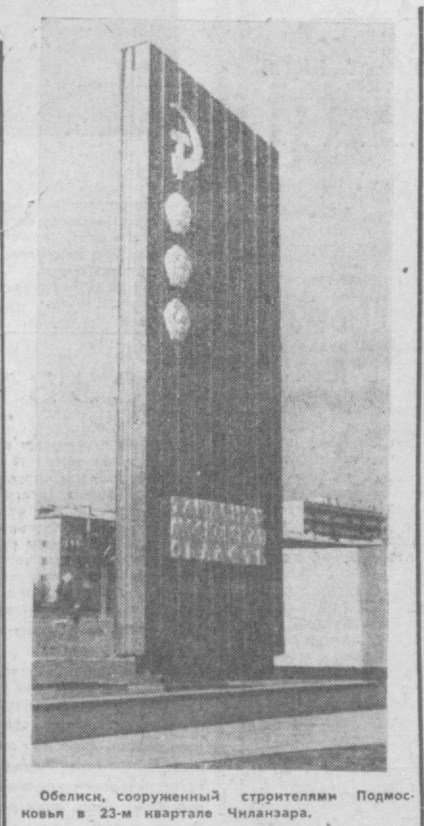
Обелиск, сооруженный строителями Подмосковья в 23-м квартале Чиланзара.