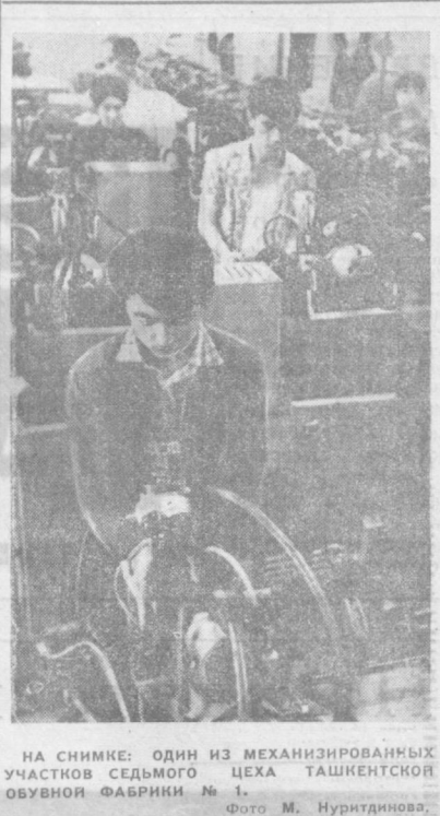
НА СНИМКЕ: ОДИН ИЗ МЕХАНИЗИРОВАННЫХ УЧАСТКОВ СЕДЬМОГО ЦЕХА ТАШКЕНТСКОЙ ОБУВНОЙ ФАБРИКИ № 1.