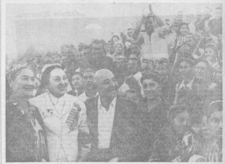
После концерта зрители сердечно благодарят любимых мастеров — народных артистов СССР Л. Сарымсакову и Т. Ханум, народного артиста УзССР С. Ходжаева.