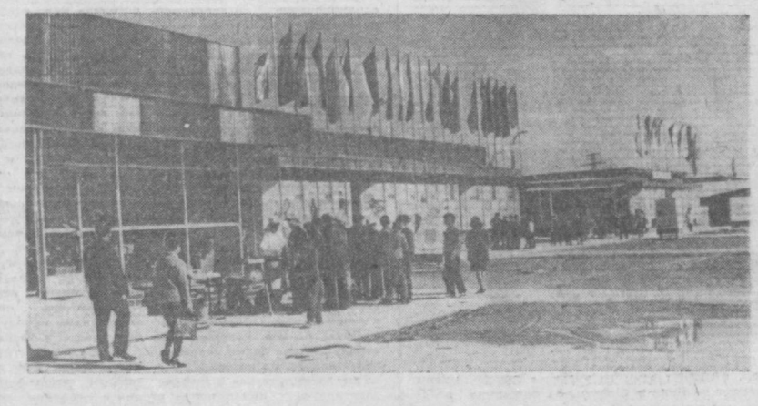
НА СНИМКЕ: ОДИН ИЗ НОВЫХ ПРОМТОВАРНЫХ ПАВИЛЬОНОВ ЯРМАРКИ НА ЧИЛАНЗАРЕ.

С большим интересом следят телезрители за «Музыкальным турниром городов» нашей страны, организованным Центральной студией телевидения. В передачах уже выступали коллективы художественной самодеятельности Сочи, Оренбурга и других городов. Жюри музыкального турнира после каждой передачи сообщало свое мнение. Получены десятки писем от телезрителей. В прошедшую субботу телезрители с большим интересом смотрели передачу, где соревновались коллективы художественной самодеятельности Ленинграда и Ташкента. По окончании ее жюри подвело предварительные итоги. Был отмечен успех ташкентцев. Музыкальный турнир городов продолжается.