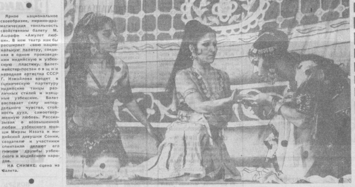
НА СНИМКЕ: сцена из балета.