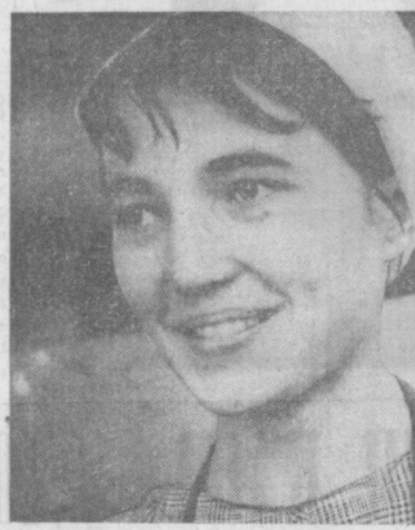
Текст и фото В. Тонарева.

В прошлом году комсомольско-молодежная бригада Людмилы Гумеровой на обувной фабрике № 1 была удостоена почетного звания «Бригада 50-летия комсомола».