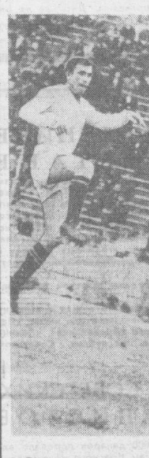
Один на один...