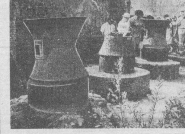
ИТАЛИЯ. Полевы — античный город в окрестностях Неаполя, погребенный под пеплом вместе со всеми своими жителями в 79 году нашей эры при извержении Везувия. Раскопки, которые велись в XVIII веке, вскрыли более половины городских построек. НА СНИМКЕ: сохранившиеся печи городской пекарни.

П РАГА. Пражский завод «Меопта», который специализируется на производстве различных оптических приборов, отмечает свое пятидесятилетие. Вряд ли предполагали два молодых пражских механика, которые в ноябре 1919 года основали небольшую мастерскую по ремонту школьных микроскопов, что через полстолетия заводской знак этого предприятия будет известен во всем мире.