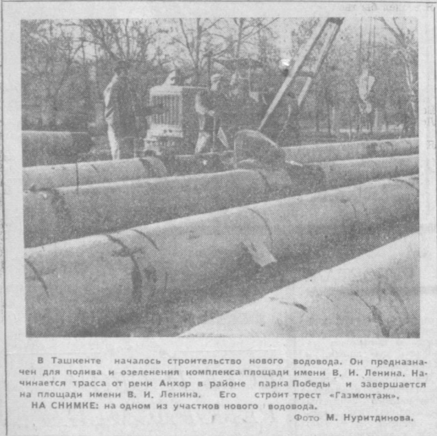
В Ташкенте началось строительство нового водовода. Он предназначен для полива и орошения комплекса площади имени В. И. Ленина.