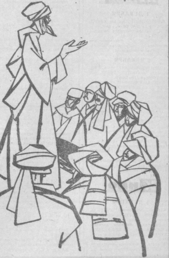
Иллюстрация к роману Сергея Бородина «Молниеносный Баязет».