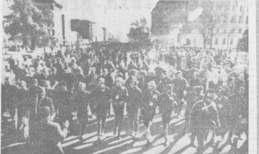
США. Несколько десятков тысяч американцев приняли участие в демонстрации протеста против войны во Вьетнаме, названной «Походом против смерти».

В Ташкенте началось строительство нового водовода. Он предназначен для полива и орошения комплекса площади имени В. И. Ленина.