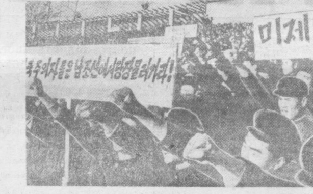
НА СНИМКЕ: митинг протеста трудящихся Пхеньяна против проислов американского империализма и их лакеев — марionеток Южной Кореи.

В районе станции Зеленчукской на Северном Кавказе продолжаются работы по созданию астрофизической обсерватории Академии наук СССР. Здесь устанавливается мощный советский оптический телескоп — БТА. Сейчас специалисты треста «Юнисталонструкция» совместно с представителями Ленинградского оптико-механического объединения и Ленинградского металлургического завода ведут монтаж телескопа С помощью стотонного крана монтажники уже ввели внутрь башни стойки телескопа. Недавно на строительство обсерватории прибыла вакуумная установка, а вслед за ней и ящики с электронно-управляющей машиной, которая будет «руководить» сложными перемещениями уникального оптического инструмента во время наблюдения небесных тел. НА СНИМКЕ: стойку телескопа доставляют к месту установки.