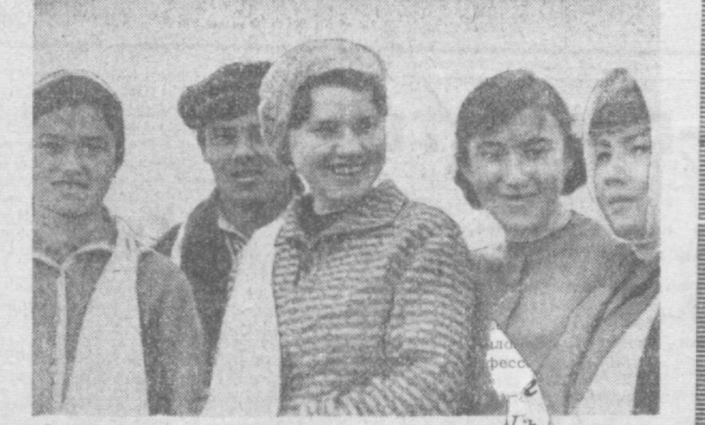
Сотрудники Министерства социального обеспечения оказывают помощь совхозу «40 лет Узбекистана» в сборе хлопка. СНИМКИ: переводчики С. Абдурахимова, А. Абдураимов, Г. Кононхинова, С. Уланова, Л. Живцова.

щихся Октябрьского района столицы. Ими с начала сезона собрано более 5 тысяч тонн сырья. Весомый вклад вносит в выполнение