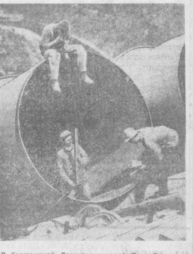
В Германской Демократической Республике с каждым годом расширяется сеть тепловых электростанций. НА СНИМКЕ: на одном из участков строительства электростанции в Хозварте.

Л АГОС. Имя Ленина, пишет ингеррийская газета «Эдванс», стало символом победы социалистической революции в СССР, символом грандиозных революционных преобразований сегодняшнего дня человечества, символом его социалистического и коммунистического будущего. Для нас, ингеррийцев, пишет далее «Эдванс», путь, указанный Лениным, — это путь борьбы за экономическую независимость нашей страны, за демократическое преобразование общества, за построение социализма.