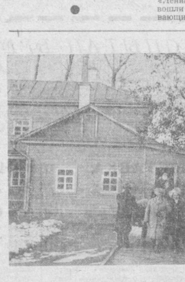
В БОГАТЕЙШЕМ ленинском наследии обнаружено 329 произведений, докладов, речей, статей и других документов, которые имеют прямое отношение к Крыму. Сейчас эти документы собраны в книгу «На Ленина равняя шаг». Подготовлен к изданию сборник «Ленин на пути озарил». В него вошли статьи и очерки, рассказывающие о связях В. И. Ленина с

Крымом в дореволюционные годы, о претворении в жизнь ленинских заветов, о преобразованиях, происшедших на полуострове за годы Советской власти. Авторы другого сборника «Мы видели и слышали Ленина» рассказывают о встречах с Ильичем. Что сделано для осуществления ленинского джета о превращении Крыма во всесоюзную здравницу для трудящихся и место отдыха и