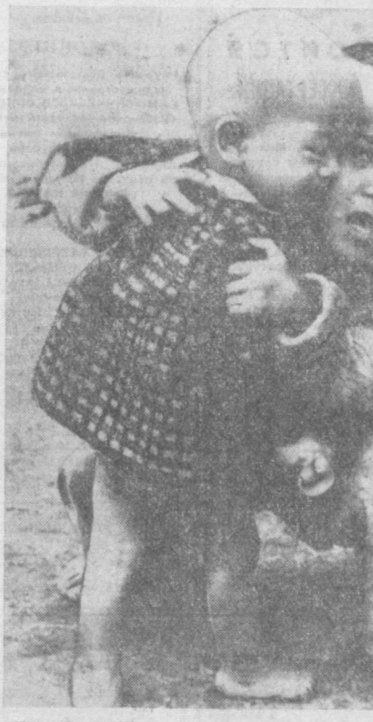
ЮЖНЫЙ ВЬЕТНАМ. Эти дети остались в живых после варварского истребления стариков, женщин и детей в южновьетнамской деревне Сонгим американскими солдатами. Снимки убитых захвачены для публикации Институтом.