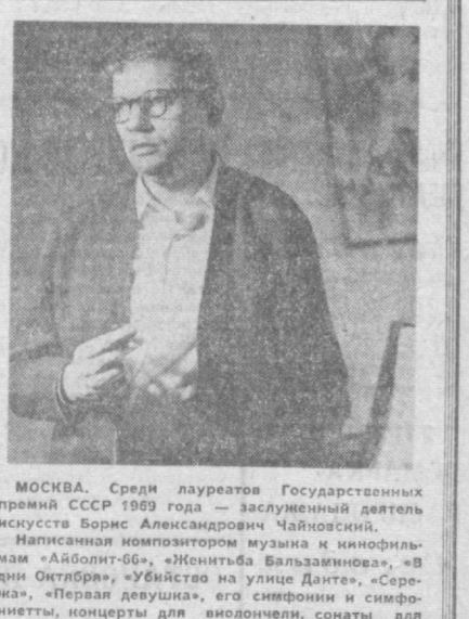
МОСКВА. Среди лауреатов Государственных премий СССР 1969 года — заслуженный деятель искусств Борис Александрович Чайковский. Написанная композитором музыка и кинофильм «Абсолют-66», «Женитьба Бальзамина», «В дни Октября», «Убийство на улице Данте», «Серебря», «Первая девушка», его симфонии и симфонетты, концерты для виолончели, сонаеты для скрипки, квартеты и другие произведения хорошо известны не только в нашей стране, но и за рубежом. Государственная премия присуждена Б. А. Чайковскому за Вторую симфонию.