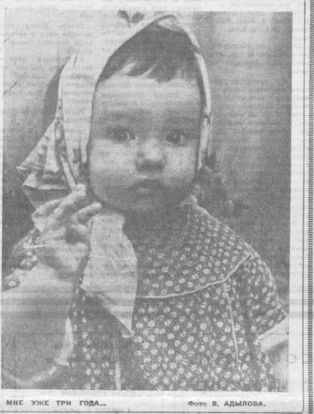
МНЕ УЖЕ ТРИ ГОДА...