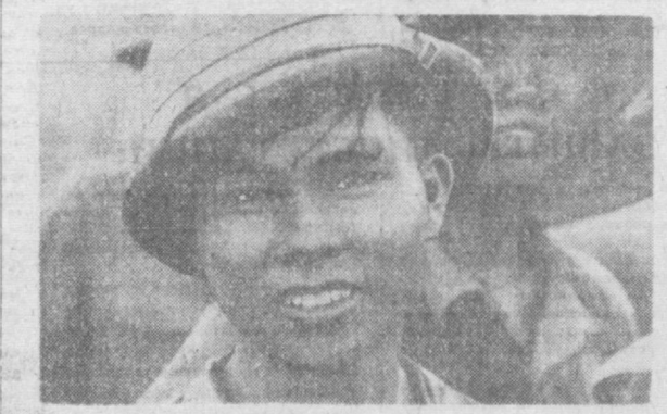
Демилитаризованная зона Демократической Республики Вьетнам принимает непосредственно и 17-й параллели. Она занимает площадь около тысячи квадратных километров. В течение многих месяцев американские интервенты бомбили эту вьетнамскую землю, разрушая сады, дороги, места, памятники культуры. Население зоны вынуждено было долгое время жить под землей, строя там жилища, детские сады, школы, госпитали. Американские варвары продолжают налеты на демилитаризованную зону и в настоящее время, вследствие чего жители ее часто приходится вновь искать спасения от американских бомб и снарядов в подземных убежищах.

демонстранты привезли с собой. Так молодежь Канады продемонстрировала солидарность с прогрессивными американцами, выступающими против преступной авиации воинов США во Вьетнаме. А. ЧЕКУЛИС.