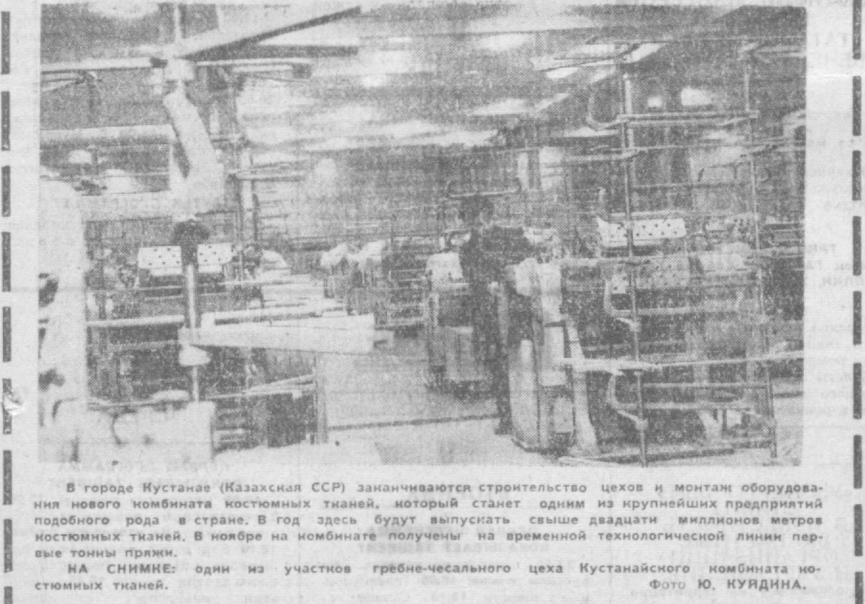
В городе Кустанай (Казахская ССР) заканчивается строительство цехов и монтаж оборудования нового комбината костюмных тканей, который станет одним из крупнейших предприятий костюмных тканей. В ноябре на комбинате получены из временной технологической линии первые тонны пряжи.

Яковлев продолжает совершенствовать метод. Раньше раствор, предназначенный для распыления, готовили на обычной воде. Сейчас для этой цели применяется минеральная вода. — Мы лечим здесь гипертонию и для этого готовим раствор на «Батайской» или «Лысогорской» воде, содержащей магний. Для лечения сахарного диабета применяем раствор на «Лугель» с ионами кальция, бромидной астмы — на «Нарзане» как углекислой воде. В кабинет врача также доставляется морская вода. В ближайшее время здесь начнет действовать инфузионная установка. Она дает возможность получать мельчайшие частицы лекарства размером 0,3—0,5 микрона. Практически этот воздух будет целиком состоять из лекарства. Кабинет получит возможность воспроизводить в камере атмосферу любого курорта. Беседа затонула. Георгий Алексеевич предложил моему приятелю также получить в камере лечебный сеанс. Проверяет давление и устанавливает диагноз: гипертония. Большая отправляется в камеру. А когда выходит, Яковлев снова проверяет у него давление: оно понижилось на десять делений. — Конечно, — говорит врач, — не думайте, что вы вылечились. Вообще говоря, снизить сбить давление можно за короткий срок и иными средствами. А для того, чтобы именованное вылечить вас, нужно пройти полный курс лечения. В том-то и дело, аэроонотерапия обеспечивает не кратковременный эффект, она влечет на самую причину, порождающую болезнь, и действительно лечит человека.