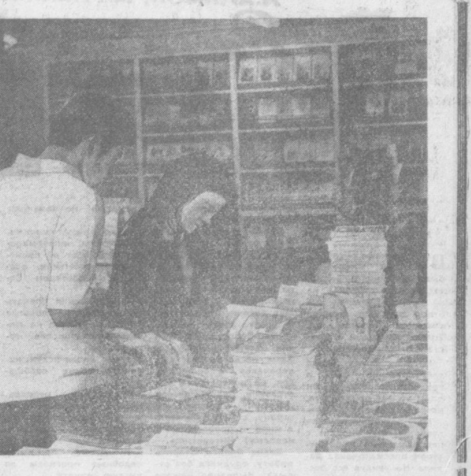
В ГВАДАЛАХАРЕ — втором по значению городе Мексики уже несколько лет работает магазин советской книги, открытый при местном филиале Института дружбы и культурных связей между Мексикой и СССР.