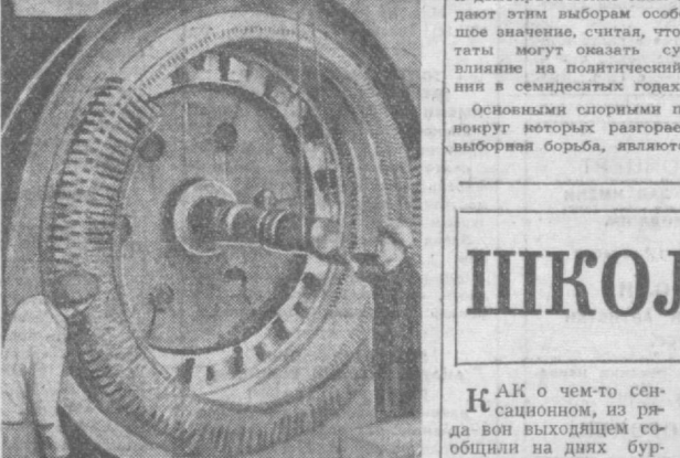
Электромеханическая промышленность КНР, опирающаяся на отечественные оборудование, материалы и собственные силы, выпускает лучшие машины и оборудование, необходимые для самостоятельного развития электроэнергетической промышленности.

БУДАПЕШТ. 8 декабря. Небывалый снегопад обрушился на Венгрию. За последние 24 часа здесь выпал слой снега толщиной в 50 сантиметров. Снег продолжает идти. Сообщение между некоторыми городами и селами прервано.