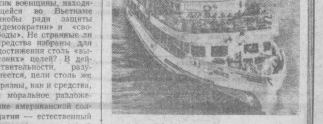
ВЕНГРИЯ. НА СНИМКЕ: туристский теплоход «Ракоши» на Дунае.

Г. ГЕРАСИМОВ, политический обозреватель.