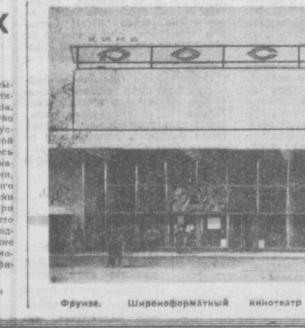
Фрунзе. Широкоформатный кинотеатр «Россия».

В НАШЕМ году в белорусском городе Барановичи открылось музыкальное училище. Это среднее специальное учебное заведение. Оно готовит специалистов хорошего дирижирования и музыкантов по специальностям: фортепьяно, струнные инструменты и др. Музыкальные училища недавно открылись также в городах Гродно и Мозыре, в юном городе белорусских химиков Новополоцке. Всего за последние три года здесь открылись на днях ные отделения музыкальных училищ увеличилось почти в два раза. Выросло количество студентов в Белорусской государственной консерватории. Здесь организованы новые кафедры: композиционного, оперно-симфонического дирижирования, истории и теории музыки. При консерватории открыто также драматическое педагогическое отделение по композиции и оперно-симфоническому дирижированию. А. ПРИКОДИНО, корреспондент АПН.