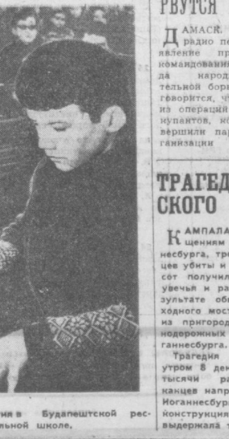
ВЕЛ'ГРИЯ. Идут занятия в Будапештской республиканской музыкальной школе.

КАМПАЛА. По сообщению из Иоганнесбурга, трое африканцев убиты и около пяти получили тяжелые увечья и ранения в результате обвала пешеходного моста на одной из пригородных железнодорожных станций Иоганнесбурга. Трагедия произошла утром 8 декабря, когда тысячи рабочих-африканцев направлялись в Иоганнесбург. Ветхая конструкция моста не выдержала тяжести идущих по нему людей, и он рухнул, одновременно раздались и тех, кто ожидал на платформе прибытия электропоезда. Случай в Иоганнесбурге — лишь свидетельство того, что власти ЮАР не только не заботятся о состоянии общественного транспорта и коммунального хозяйства для людей, от которых они отгородились высоким оградением и железобетонной стеной апартеида.