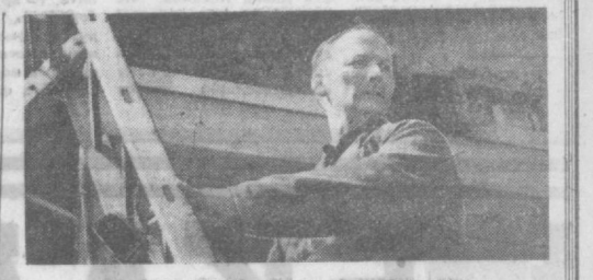
ПО ЛЕНИНСКИМ МЕ СТАМ ШВЕДЦАРИИ.