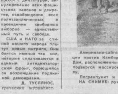
Американско-сайгонская военщина продолжает вооруженные провокации против Камбодии. Недавно камбоджийский пограничный пункт Дак Дам, расположенный в 7 километрах от границы с Южным Вьетнамом, подвергся массированному бомбардировкам и артиллерийскому обстрелу.

Погранничные и прилегающие деревни полностью уничтожены. НА СНИМКЕ: руины жилых зданий в поселке Дак Дам.