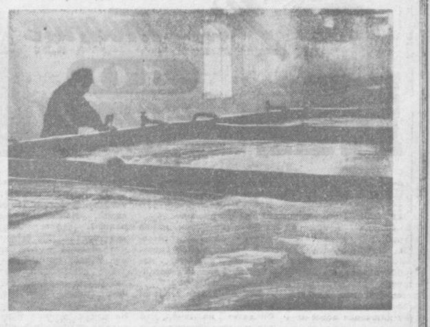
ВЕНГРИЯ. Один из цехов Будапештского пивоваренного завода.

Погранничные и прилегающие деревни полностью уничтожены. НА СНИМКЕ: руины жилых зданий в поселке Дак Дам.