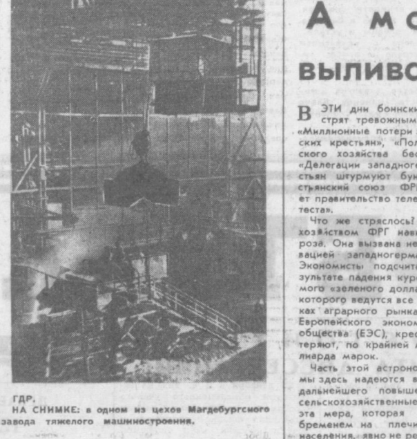
ГДР. НА СНИМКЕ: в одном из цехов Магдебургского завода тяжелого машиностроения.