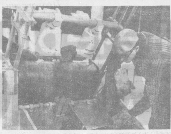
Сообщают корреспонденты ТАСС и АПН