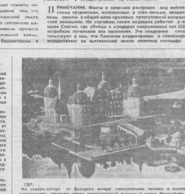
ГДР. На северо-западе от Дрездена между смешанными лесами и многочисленными прудами лежит великолепный барочный замок Морницбург.

ВАШИНГТОН. Вице-председатель федеральной резервной системы США Дж. Робертсон заявил, что рост стоимости жизни в стране вынуждает правительство прибегать к еще более жесткому контролю над финансами страны. Робертсон подчеркнул, что население должно смириться с необходимостью принятия ряда болезненных мер. Под предлогом борьбы с инфляцией правительство США уже пошло на продление срока действия дополнительного подоходного налога. Помимо этого, президент Никсон потребовал от руководителей профсоюзов прекратить выдвигание требований о повышении заработной платы. Последствия подобной политики, по мнению многих американских экономистов, ложатся все более тяжелым бременем на плечи трудящихся. «Национальная экономика», говорится в отчете агентства ЮПИ, — вступает в 1970-е годы в фазу непрекращающейся инфляции. Как предполагает ЮПИ, «безработица в предстоящие годы будет расти».