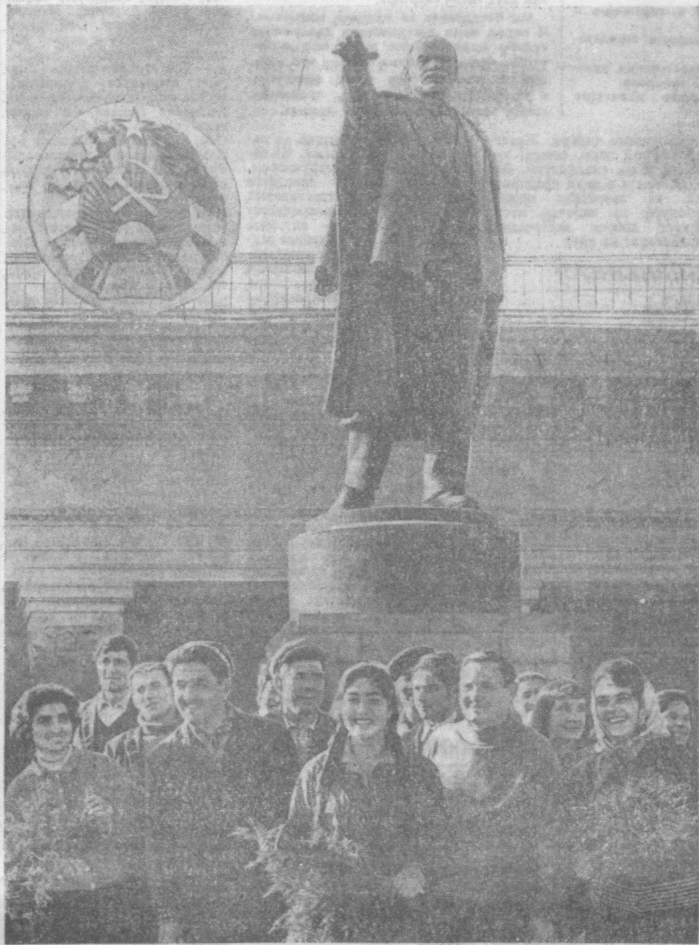
Все советские республики участвуют в строительстве Ташкента. Среди монтажников, бетонщиков, наемников — люди шестидесяти национальностей. На снимке: молодые строители Ленинского проспекта у памятника Ильичу.

устранении силами всей страны. Стихия разом снесла больше двух миллионов квадратных метров полезной площади. Построено с тех пор больше трех. Когда люди добровольно соединяются вместе для работы, в Узбекистане это называют хашаром. Только хашар в Ташкенте особенный — всеосознанный Дружба народов — одно из проявлений нашей социалистической демократии. Полвека назад В. И. Ленин писал коммунистам Туркестана: «Товарищи! Пользуйтесь мне обратиться к вам не в качестве Председателя Социариума и Совета Обороны, а в качестве члена партии».