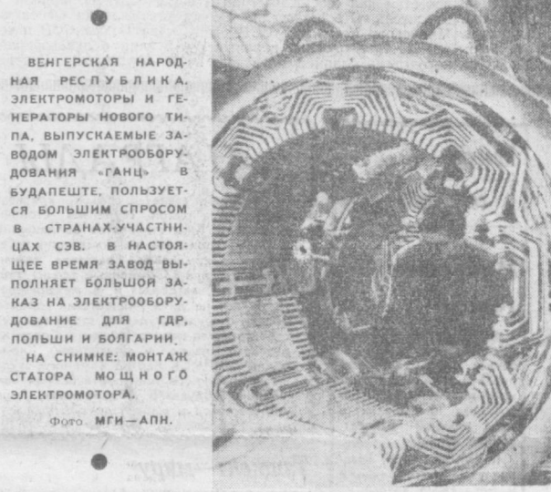
ВЕНГЕРСКАЯ НАРОДНАЯ РЕСПУБЛИКА. ЭЛЕКТРОМОТОРЫ И ГЕНЕРАТОРЫ НОВОГО ТИПА. ВЫПУСКАЕМЫЕ ЗАВОДОМ ЭЛЕКТРООБОРУДОВАНИЯ «ГАНЦ» В БУДАПЕШТЕ, ПОЛЪЗУЕТСЯ БОЛЬШИМ СПРОСОМ В СТРАНАХ-УЧАСТНИЦАХ СЭВ. В НАСТОЯЩЕЕ ВРЕМЯ ЗАВОД ВЫПОЛНЯЕТ БОЛЬШОЙ ЗАКАЗ НА ЭЛЕКТРООБОРУДОВАНИЕ ДЛЯ ГДР, ПОЛЬШИ И БОЛГАРИИ.

БУХАРЕСТ. Ни днем, ни ночью не смолкает шум на гигантской строительной площадке у «Железных ворот» на Дунае, где сооружается крупнейший в Европе гидроэнергетический комплекс. 14 ведущих румынских заводов и десятки предприятий из братских стран поставляют сюда оборудование... Уже вступил в строй первый шлюз, через который теперидут целые караваны грузовых судов. На его механизмах, наряду с таблицами заводов Ре-и других... На площадке уже до-ставлено оборудование для первой турбины мощностью 178 мегаватт. Ее вес составит около 10 тысяч тонн.