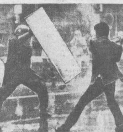
В ЛЕНИНИ ШИРИТСЯ ДВИЖЕНИЕ ПРОТИВ РАЗМЕЩЕНИЯ АМЕРИКАНСКИХ ВОЕННЫХ БАЗ НА ЯПОНСКОЙ ТЕРРИТОРИИ, ПРОТИВ ЯПОНО-АМЕРИКАНСКОГО «ДОВОДА БЕЗОПАСНОСТИ».