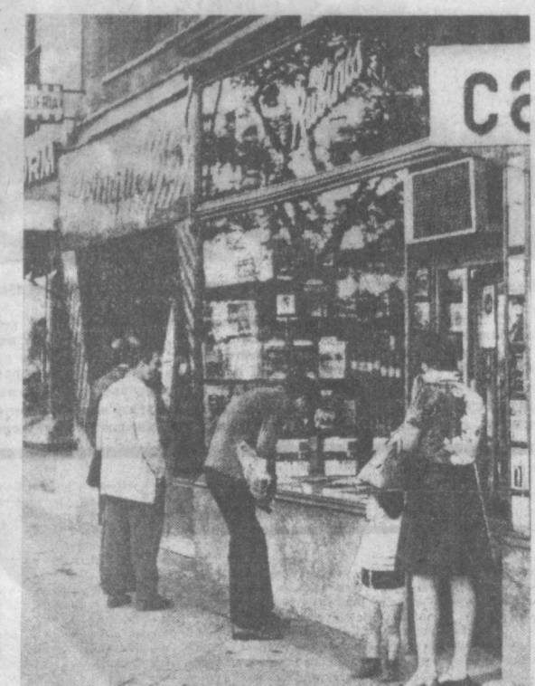
МАДРИД. В этом магазине художественной литературы открылась первая в Испании выставка советской книги.