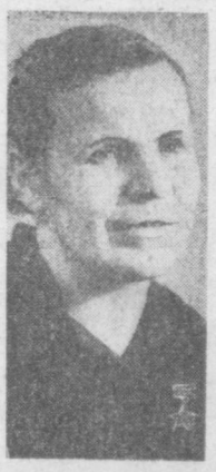
Ни один год не уходит из жизни бесследно. Каждый отмечен чем-то своим, неповторимым. А этот особенно. Мы, рабочие «Ташсельмаша», объявили его ударным, ленинским. Предприятие взяло

курс на расширение мощности. Механическому цеху, в котором я работаю наладочницей станков, предстоит в ближайшее время значительно раздвинуть свои границы, а после реконструкции увеличить выпуск изделий.