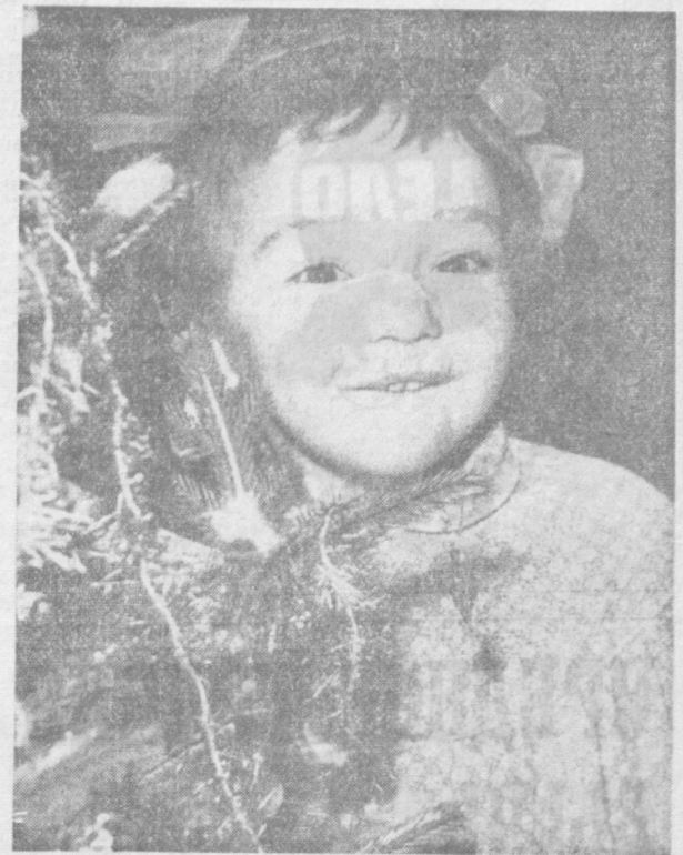
Как красиво!