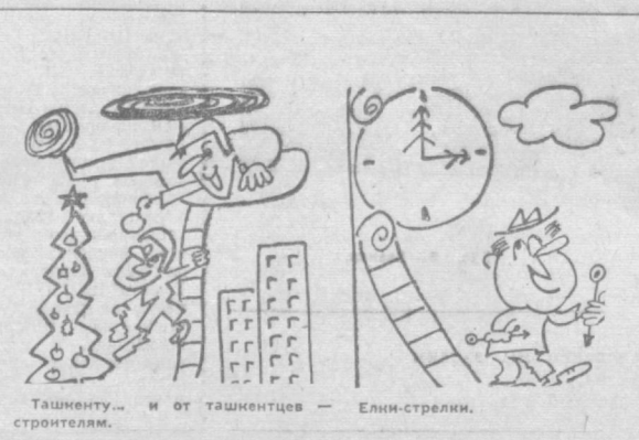
Ташкенту... и от ташкентцев — Ели-стрелки, стронтелям.