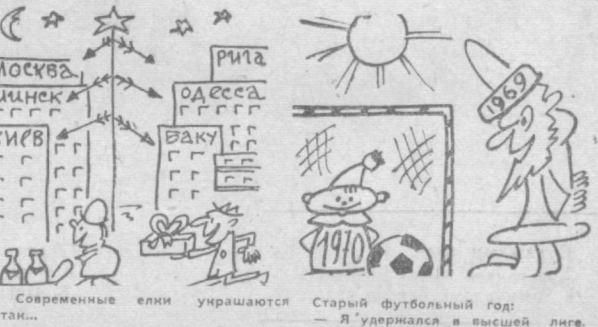
Современные елки украшаются Старый футбольный гол: — Я удержался в высшей лиге. А ты сможешь? Рис. И. Суцверера.