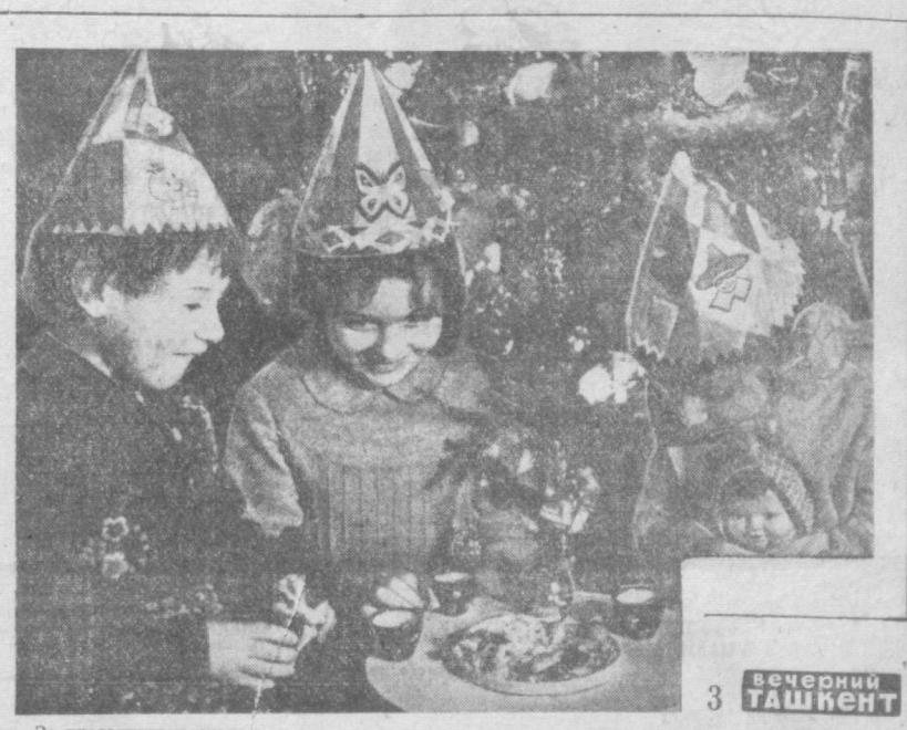
За праздничным столом.

внуков и внучек, сыночек и дочерей (рис. 4). Потом дети идут спать — им предстоит посещение десятков новогодних елок, карнавалов. Чтобы не ошибиться в их расписании, родители составляют график посещения и вывешивают его на приметном месте (рис. 5). Но вот все приготовления закончены, и горожане собираются за новогодним столом. Приближается Новый год, великий для нас 1970 год. Через несколько минут ташкентские куранты пробьют двенадцать раз, город потрясает залп открываемого шампанского, и... С Новым годом, дорогие ташкентцы! (рис. 6). Г. ПЛЕТИНСКИЙ, М. САМОЯЛОВ. Рисунки авторов.