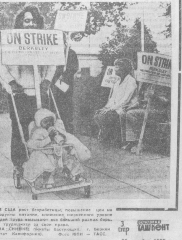
В США рост безработицы, повышение цен на продукты питания, снижение жизненного уровня людей труда вызывают все больший размах борьбы трудящихся за свои права. НА СНИМКЕ: пикеты бастующих в Берлине (штат Калифорния).

РАБАТ. В центре Рабата находится двухэтажное здание Государственного археологического музея Марокко. В его выставочных залах собраны богатые экспонаты, относящиеся к доисламскому периоду государства, находившегося на территории современного Марокко. Римские историки называли его «Тингитанской Мауретанией».