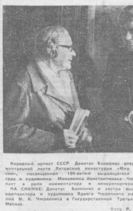
Народный артист СССР Донатас Банионис впервые сыграл в документальной ленте Литовской киностудии «Мир как боковая симфония», посвященной 100-летию выдающегося литовского композитора и художника Микалоюса Константинаса Чюрляниса. Актер выступает в роли комментатора и кинорежиссера. НА СНИМКЕ: Донатас Банионис и сестра выдающегося литовского композитора и художника Ядвиги Чюрляниса на выставке произведений М. К. Чюрляниса в Государственной Третьяковской галерее в Москве.

РУССКИЙ ЯЗЫК В ПОРТУГАЛИИ ЛИССАБОН. Вот уже давно год здесь работают курсы русского языка. Они действуют при Обществе друзей «Португалия — СССР». Работники, служащие, представители интеллигенции, учащаяся молодежь — всего 120 человек — активно изучают русский язык, знакомятся с историей, литературой и искусством Советского Союза, с достижениями Страны Советов в области экономики. Помимо столицы страны, русский язык изучают около ста человек при филиале Общества друзей «Португалия — СССР» в городе Порту. В течение почти полувека народ Португалии находился под гнетом фашистской диктатуры, находившейся в международной изоляции, сказал в беседе с корреспондентом ТАСС вице-президент общества Арманду Миредорриш. С большим трудом в нашу страну проникла правда о Советском Союзе. После революции 25 апреля 1974 года перед португальцами открылись широкие возможности для знакомства с жизнью и успехами советского народа. Именно поэтому на курсы очень много, но возможности нашего общества пока ограничены, подчеркнул в заключение А. Миредорриш. М. АРТУШЕНКОВ.