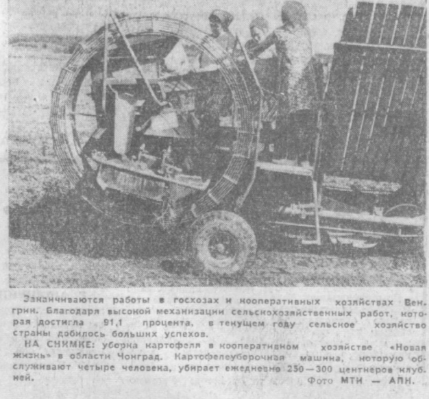
Заканчиваются работы в горах и неоперативных хозяйствах Венгрии. Благодаря высокой механизации сельскохозяйственных работ, которая достигла 81,1 процента, в текущем году сельское хозяйство страны добилось больших успехов.

Подвиг тех, кто вывел человечеству лик Зухры — Венеры, достойны самых горячих поэтических строк. (УзТАГ).