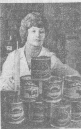
г. Боржом, Грузинская ССР.