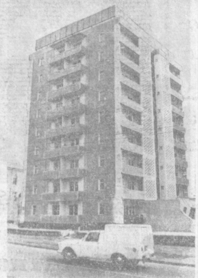
ТАШКЕНТ СЕГОДНЯ. Новый жилой дом на проспекте Горького.