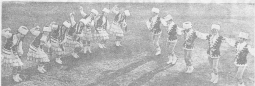
Народный ансамбль танца Верхневолжского района Дома культуры завоевал признание не только в Башкирии. Искусство его исполнителей знакомо жителям многих городов. С успехом прошли гастроли ансамбля и в ГАР.