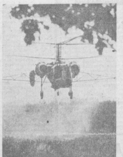
Борьба с вредителями леса входит в обязанности работников лесных хозяйств ГДР. Обязательство работников советских вертолет «А-26». С его помощью опрыскивание участка леса гербицидами, на котором уходило несколько часов, проводится за несколько минут. При каждом вылете вертолет, летящий на высоте пяти метров, обрабатывает до 20 гектаров леса.

АДДС-АББА. «Прима родина» — так называется новый документальный фильм, вышедший на экраны Аддис-Абебы и других городов Эфиопии. Под авторством кинодела рассказывает о производной в стране национальной трудовой кампании в деревне.