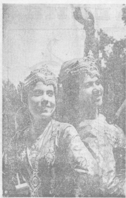
Участники ансамбля народного танца клуба «Восток».