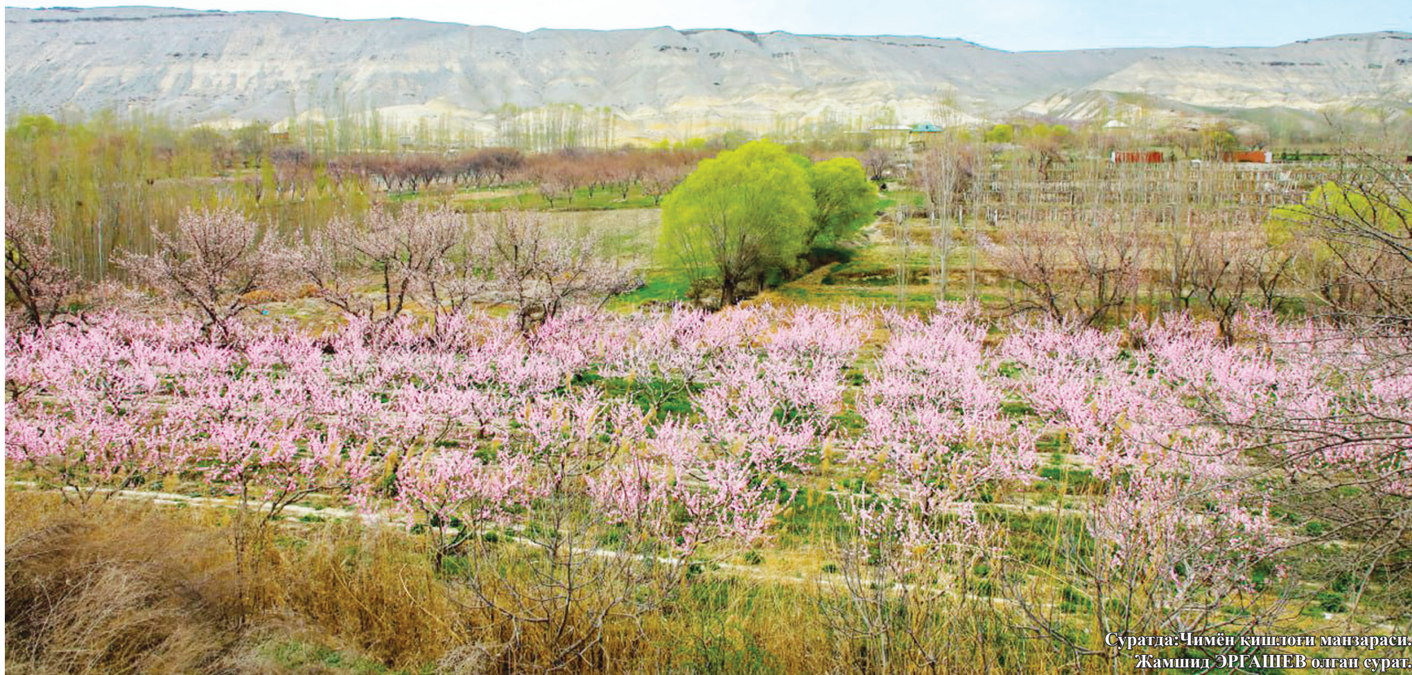
Суратда Чимён қишлоғи манзараси.