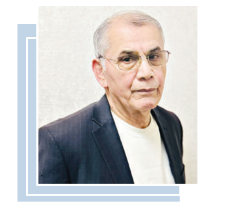
ри уюшмалари ўртасидаги ҳамкорлик янги босқичга чиқди. Фаол алоқаларга киришди. Республикаларимиз ўртасидаги дипломатик алоқалар қардош мамлакат адилларининг ижодий фаолиятида ҳам ўз аксини топмоқда.

Тожикистон ва Ўзбекистон адаблари ўз салафларининг тарихий анъаналарини давом эттириб, бойитиб, яқин ҳамкорликда қардош халқларимиз фаровонлиги йўлида мақсадли ижодий фаолият юритмоқда. Кейинги йилларда Ўзбекистон ва Тожикистон Ўзвчилар