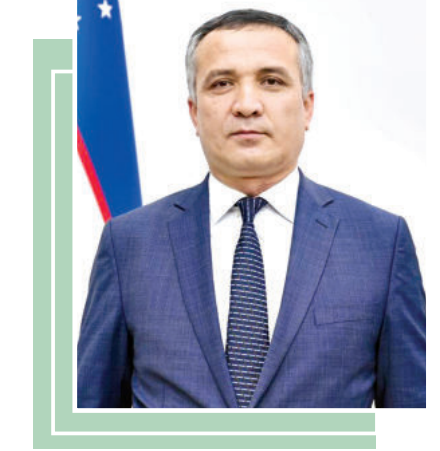
Абдуваққос РАФИҚОВ, Вазирилар Маҳкамаси ҳузуридаги Саноат, радиация ва ядро хавфсизлиги қўмитаси раиси

Қўмига халқроқ ва хорижий ташкилотлар билан мустаҳкам ҳамкорлик қилиш, соҳа фаолиятига тааллуқли бўлган атом энергиясидан тинчлик мақсадларида фойдаланиш, кимёвий, бактериологик (биологик) ва захарли курол-яроғни тақиқлаш, шунингдек, кимёвий, биологик, радиологик ва ядро материаллари таъсири хавфини пасайтириш бўйича халқроқ шартномалар доирасида Ўзбекистоннинг мажбуриятлари бажарилишини таъминлаб келмоқда.