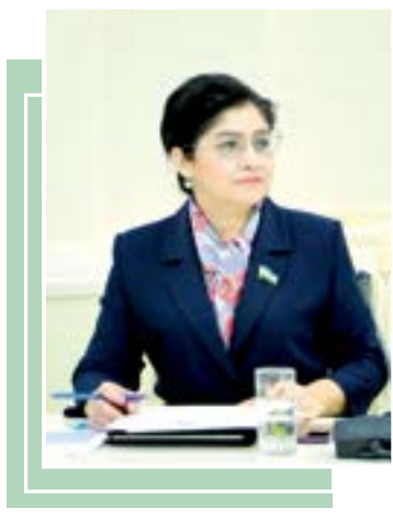
Малика ҚОДИРХОНОВА, сенатор