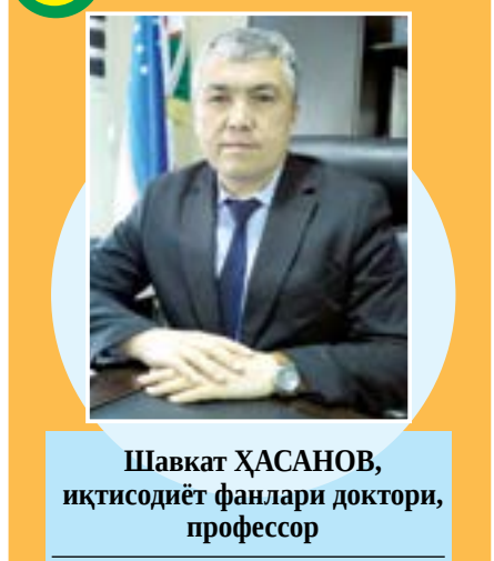
Шавкат ҲАСАНОВ, иқтисодиёт фанлари доктори, профессор

Ўзбекистонда бозор охиқотларини амалга ошириш, жумладан, барқарор иқтисодий ўсишга эришиш, миллий иқтисодиётда туб таркибий ўзгаришларни рўйбага чиқариш фаол инвестиция сиёсати билан узвий боғлиқ. Бунинг аҳамияти мамлакатимизнинг жаҳон бозорига интеграциялашуви билан янада долзарблик касб этади.