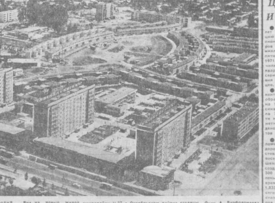
ТАШКЕНТ СЕГОДНЯ. Вид на новый жилой микрорайон Ц-27 в Октябрьском районе столицы.

Ночами эстонские строители работали на сооружении детского сада в этом же районе Ташкента. Ночами, потому что для северян сорокаградусная жара была в диковинку. Но жарой за труд стало то, что построенный детский сад был признан лучшим по качеству и планировке.