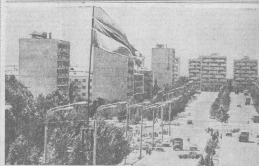
ТАШКЕНТ СЕГОДНЯ. Чиланзар, квартал В-23, возведенный строителями Российской Федерации.

Заканчиваются проектные разработки мемориальной зоны Ташкента, создаваемой на территории, разбитой на территории от площади Хадра до рынка и от улицы Саган до улицы Хамза. Здесь именно здесь сохранены уникальные памятники архитектуры — мечети Баракхан, Каффал Шаши и другие. Вокруг них на площади более десяти гектаров будут сооружены уникальные сооружения и архитектурные памятники.