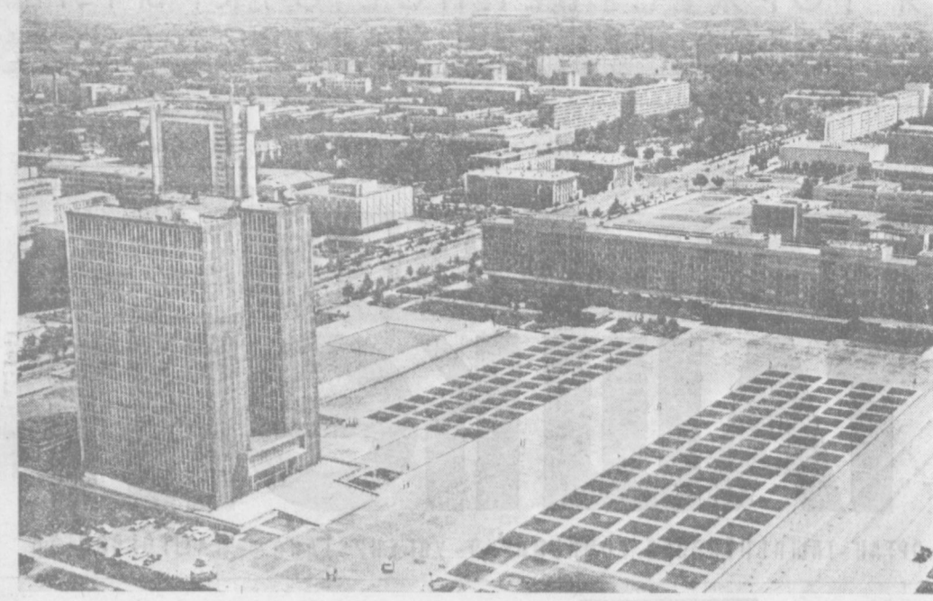
ТАШКЕНТ СЕГОДНЯ. Вид на центр города.

ТАШКЕНТ, снискавший себе славу города братства и интернациональной дружбы, за десятилетие стал поистине неузнаваемым, превратился в один из красивейших и благоустроенных городов страны. Оглядываясь вокруг его улицы и про-