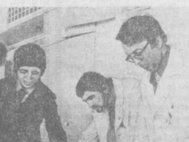
НА СНИМКЕ: группа архитекторов обсуждает новый район застройки «Тракия».

Строительные работы в разгаре. Однако представить Дворец искусства можно уже сейчас — в экскурсионном здании стал замечательным директором строящегося галереи В. И. Фиохниц. (ТАСС).