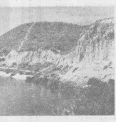
Вот так же подрезал канал крутые склоны большого холма, и обнажились слои с разноцветными осколками керамической посуды. Холм оказался с опасными руинами большой древней цитадели, окруженной глубоким рвом. Рядом располагается городище. Все его строения давно погребены под землей. А чуть поодаль в обширной котловине между холмами видны курганы. Тысячелетия тому назад здесь совершали обряды захоронения племена «Кочевников-скотоводов».

Уже несколько лет на берегах Карасу работают археологи. Раскопано несколько древних курганов, на городище выявлены остатки древних сооружений, сделаны интересные находки орудий труда, посуды, украшений, монет.