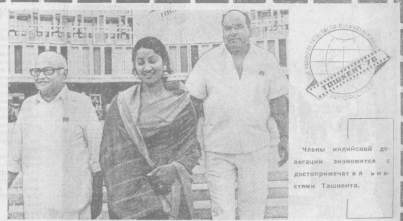
Члены индийской делегации знакомятся с достопримечательностями Ташкента.

24 мая в Кремле начались советско-английские переговоры.