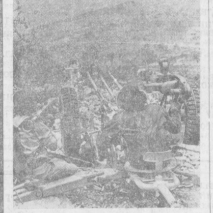
БЕИРУТ. В Ливане сохраняется напряженная обстановка. Последние дни отмечены резким усилением вооруженных столкновений на всех фронтах — в Бейруте, его пригородах, особенно в горном Ливане. Бой с применением артиллерии и танков происходил в горных районах Айн-Тур, Мтайн, Биншадия и Фарая. Мощная артиллерийская дуэль происходила между восточной и западной частями Бейрута. Десятки снарядов взорвались в густонаселенном западном районе столицы. Убито около 70 человек.

Американская фирма «Куртра» начала выпуск необычных колец, в которые вместо драгоценного камня монтируется миниатюрная кварцевая камера, запечатленная лидирующим артеллом. По словам журналиста «Ньюсуин», цвет жидкого кристалла меняется в зависимости от преломления окружающей среды. Состоит кольцо из прозрачного пластика, в центре которого — черный и т. д.