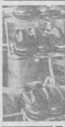
Коллектив обувной фабрики № 2 освоил в нынешнем году 54 новых модели мужской и женской обуви. Среди лучших производителей предприятия — номсолома Г. Зарипова.