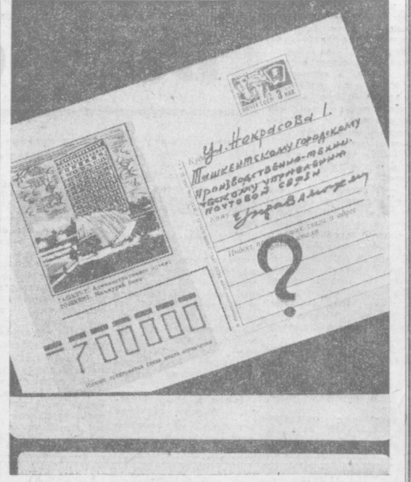
Ташкентское городское производственно-техническое управление почтовой связи.

ВНИМАНИЮ РУКОВОДИТЕЛЕЙ ОРГАНИЗАЦИЙ, ПРЕДПРИЯТИЙ, УЧРЕЖДЕНИЙ! Для своевременной доставки корреспонденции ПРОСИМ ВСЕХ РУКОВОДИТЕЛЕЙ ПРИ ПЕРЕЕЗДЕ ОРГАНИЗАЦИИ С ОДНОГО АДРЕСА НА ДРУГОЙ СООБЩАТЬ СВОЕ НОВОЕ МЕСТОНАХОЖДЕНИЕ. ТАШКЕНТСКОМУ ГОРОДСКОМУ ПРОИЗВОДСТВЕННО-ТЕХНИЧЕСКОМУ УПРАВЛЕНИЮ ПОЧТОВОЙ СВЯЗИ ПО АДРЕСУ: 700000, Ташкент, П. ул. Некрасова, 1.