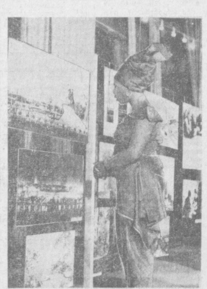
С УСПЕХОМ в столице Того—Ломе демонстрируется советская фотоавтоматика «СССР — страна и люди».