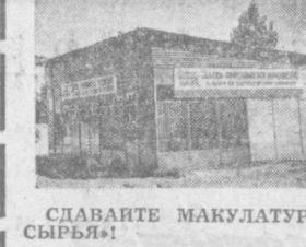
СДАВАЙТЕ МАКУЛАТУРУ ОРГАНИЗАЦИЯМ «ВТО

Принимаются не сильно загрязненные старые газеты, журналы, книги, тетради, проспекты, оберточная бумага. За один килограмм макулатуры выплачивается 2 копейки и выдается обменный талон.