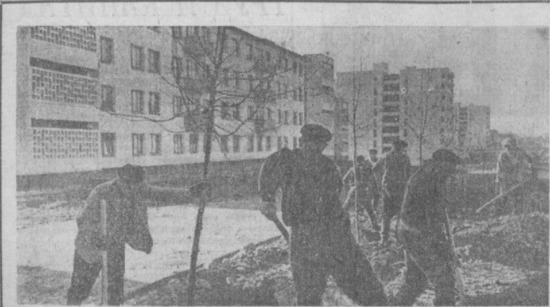
На строительстве центрального проспекта имени М. Горького, Слева — рабочие городского управления благоустройства и озеленения ведут посадку декоративных деревьев в микрорайоне Ц-4. Справа — часть проспекта в микрорайоне Ц-5. Жилые дома, возведенные строителями Подмисновья, Краснодар и Новосибирска.

▲ РИМ. (ТАСС). Работы по спасению знаменитой «падающей» башни в итальянском городе Пизе начнутся в 1971 году. Об этом сообщил председатель комитета по ее спасению Федерико Торнар. На работы выделено более трех миллиардов лир. В течение 1970 года правительственная комиссия должна рассмотреть более трех тысяч проектов спасения этого замечательного памятника итальянского зодчества, поступивших из многих стран мира, в том числе из Советского Союза. Исследования показали, что отклонение верхней части башни от оси ежегодно увеличивается на один миллиметр.