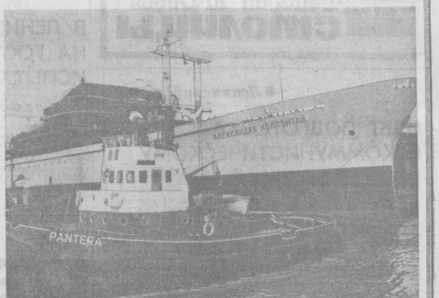
ПОЛЬСКАЯ НАРОДНАЯ РЕСПУБЛИКА. На судостроительной верфи в Гданьске началось строительство рефрижераторных судов нового типа, при конструировании которых были учтены все последние достижения судостроения в этой области. Все серии новых рефрижераторов делается по заказу Советского Союза. НА СНИМКЕ: новый рефрижератор «Александра Коллонтай» в доме судостроительной верфи в Гданьске.

На одной из пресс-конференций президент Р. Никсон признал, что он намерен изменить свою точку зрения, тем более что оно добилось очередного продления срока действия дополнительного подоходного налога, принятого еще при правительстве Джонсона в качестве «временной меры».