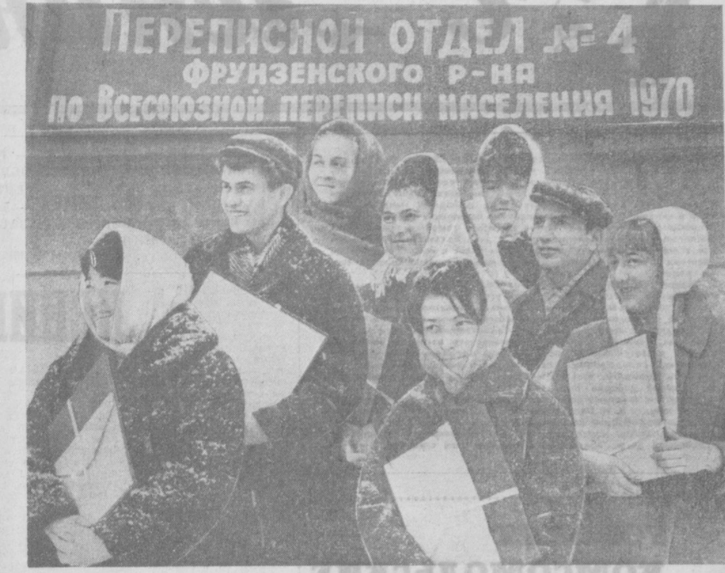
250 счетчиков Фрунзенского района г. Ташкента проводят перепись населения в своем районе. НА СНИМКЕ: группа счетчиков четвертого отдела по переписи населения.