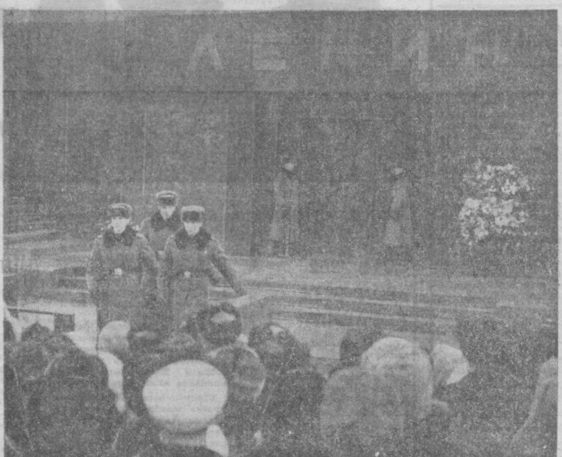
МОСКВА. Красная площадь. Смена почетного караула у Мавзолея В. И. Ленина.