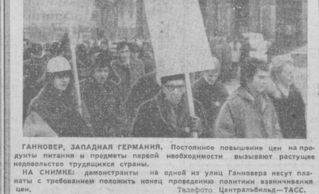
ГАННОВЕР, ЗАПАДНАЯ ГЕРМАНИЯ. Постоянное повышение цен на продукты питания и предметы первой необходимости вызывают растущее недовольство трудящихся страны. НА СНИМКЕ: демонстранты на одной из улиц Ганновера несут плакаты с требованием положить конец цен.