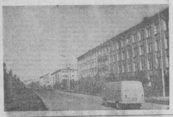
ТАШКЕНТ СЕГОДНЯ. УЛИЦА ВОГДАНА СМЕЛЬНИЦКОГО.