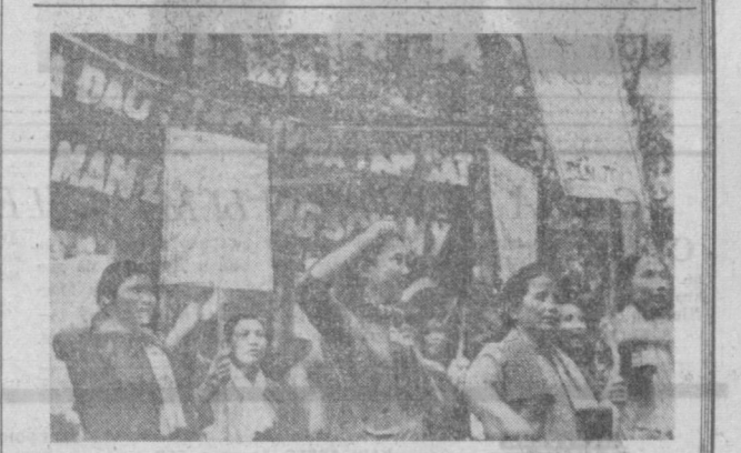
ЮЖНЫЙ ВЬЕТНАМ. ЖИТЕЛИ ОДНОГО ИЗ ОСВОБОЖДЕННЫХ РАЙОНОВ ЮЖНОГО ВЬЕТНАМА ПРОТЕСТУЮТ ПРОТИВ ПРЕСТУПЛЕНИЯ АМЕРИКАНСКОЙ ВОЕНЩИНЫ В ОБЩИНЕ СОГММ.

Критикуя практически все аспекты политики нынешнего правительства, консерваторы в то же время не в состоянии предложить сколь-либо разумный выход из создавшегося положения. Обещая сокращение налогового бремени и стабилизацию цен (что традиционно судят англичанам все стремившиеся к власти партии), они не указывают конкретных путей реализации этих обещаний.