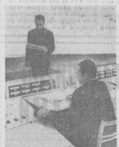
Центральная диспетчерская служба объединенной энергосистемы УзССР. Отсюда идет распределение электроэнергии для нужд республики.