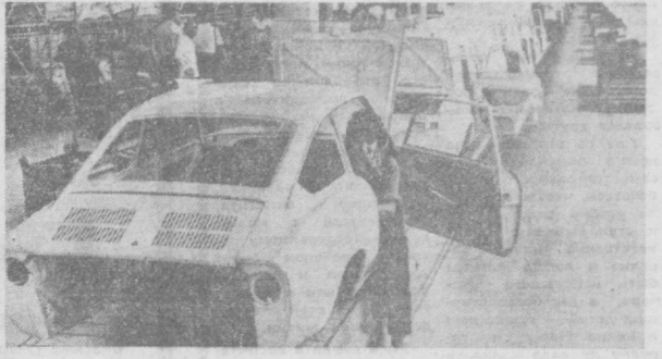
Автомобилестроение — одна из самых молодых отраслей болгарской индустрии. Города Пловдив, Шумен, Ловеч стали центрами нового вида промышленности. «Москвич-408» и «Москвич-412», «Рила», «Фиат-850» и «Фиат-124», спортивный лимузин «Булгарлинч» «ГАЗ-53» — вот марки машин, монтаж которых успешно освоил на автозаводе НРБ. НА СНИМКЕ: конвейер сборки легковых автомобилей.

УЛАН-БАТОР. «Кто лучше знает Ленина?» — такова тема радиоанкеты для школьников, объявленной центральным комитетом Монгольского революционного союза В. И. Ленина, о претворении ленинского учения в жизнь Монголии. Для победителей установлены премии, среди которых три путевки в венный комитет по информации, радиовещанию и телевидению при Совете Министров МНР. Участникам анкеты предлагается ответить на вопросы о жизни и деятельности В. И. Ленина, о претворении ленинского учения в жизнь Монголии. Для победителей установлены премии, среди которых три путевки в венный комитет по информации, радиовещанию и телевидению при Совете Министров МНР.