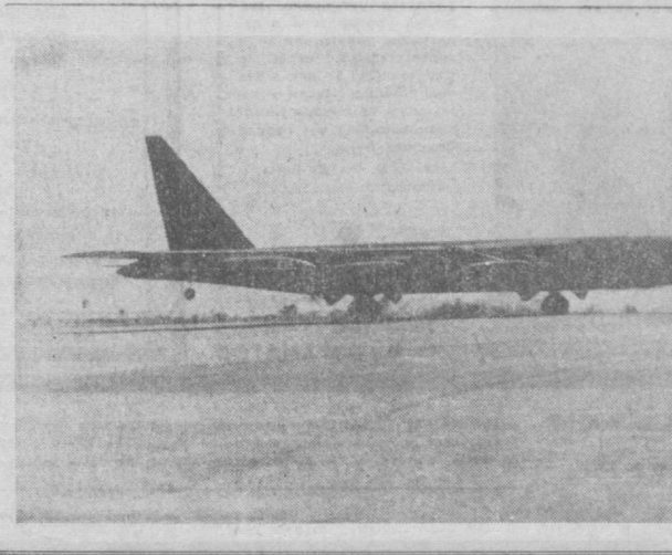
НА СНИМКЕ: взлетает бомбардировщик «Б-52». Курс — Южная Вьетнам. Цель — доревин и рисовые поля Южновьетнамцев.

«АМЕРИКАНЦЫ считают своим долгом заглянуть в карман к лучшему другу», — к такому выводу приходит бельгийская печать, анализируя американско-бельгийские экономические отношения. В настоящее время объектом усиленного проникновения США стала бельгийская промышленность. Американские магнаты стремятся захватить контрольные пакеты акций крупнейших бельгийских заводов, расположенных в долине реки Самбр. Вместе с тем с помощью таможенных тарифов они усиленно пытаются открититься от закупок бельгийского стекла. Недавно в Соединенных Штатах вновь повисли на него тараты, что поставило экспортеров в очень трудное положение. В последнее время в печати появились сообщения о том, что американцы завладели также контрольными пакетами многих электротехнических, электронных и химических предприятий Бельгии. Причем на «захваченных» предприятиях они пытаются установить свои порядки, парализовать профсоюзные организации. Тревожное положение, создавшееся в бельгийской экономике в связи с проникновением американского капитала, вызывает широкие протесты. Прогрессивные организации страны требуют от правительства принять действенные меры против хозяйничанья монополии США и укрепления суверенитета страны. В статье, которая появилась в бельгийской печати, подчеркивается, что экономические партнеры, любящие поговорить о «равноправии и солидарности» в рамках НАТО, на практике проводят политику выжирания рук и карманов своих младших партнеров. В. ТОВОП.