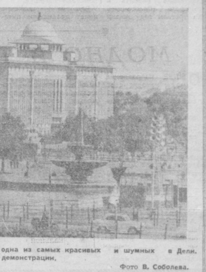
ИНДИЯ. Центральная магистраль Ради-Патх — одна из самых красивых и шумных в Дели. Здесь проходят торжественные парады и демонстрации.

БОНН. В западногерманской столице не собираются отказываться от провокационных вылазок депутатов боннского бундестага в Западной Берлин. В интервью западногерманскому радио председатель бундестага фон Хассель оправдывал «право» боннского парламента на «одновременное присутствие» всех его членов в Западной Берлине. Я твердо считаю, заявил он, что «наше присутствие» в Западной Берлине является «нашим правом». Это высказывание фон Хасселя явно противоречит неоднократным утверждениям правительства ФРГ о том, что оно выступает за разрядку напряженности в Европе и нормализацию отношений между обоими германскими государствами.