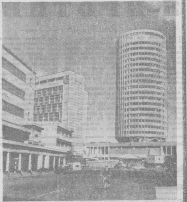
Новая гостиница в центре Найроби. В современном здании в форме цилиндра размещены 400 номеров и самый большой в Африке ресторан.