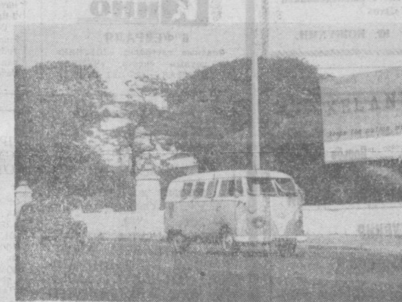
Слово «Келани» известно в самых отдаленных районах Цейлона. Так называются шини, которые производит завод, построенный с экономической и технической помощью Советского Союза. В этом году предпринят на 95% удовлетворить потребности страны в шинках. НА СНИМКЕ: реклама шин «Келани».

НА СНИМКЕ: бастующие горняки у шахты Андра Дюмон.