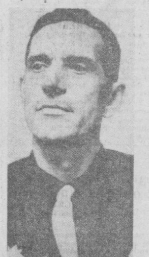
Владимир Ильич в Узбекистане. Он всегда думал и заботился об узбекском народе. И мне хотелось воплотить образ любимого вождя на полотне.

—В ГОД, когда не стало Ильича, я вступил в пионерскую организацию, через 10 лет — в Ленинский комсомол. А в самые тяжелые дни боев на Керченском полуострове я решил вступить в партию Ленина. Если не выживу — погибну коммунистом. — писал я тогда в заявлении. За штурм Севастополя, Салун-горы мне присвоили высокое звание Героя Советского Союза. А когда вручал орден Ленина и Золотую Звезду Михаил Иванович Калинин, не выдержал, заплакал. Это были слезы радости.