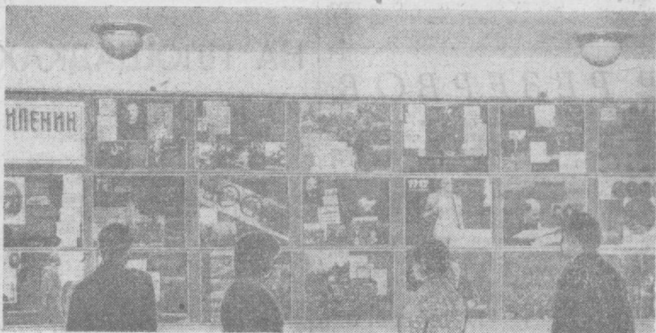
У ленинского стенда на вагоноремонтном заводе имени 50-летия Ташсоветов.

Ташкента, как одного из центров обороны против империалистического натиска, постановил в заседании 14 апреля 1924 года наградить пролетариат города Ташкента орденом Красного Знамени. М. Калинин, председатель ВЦИК.