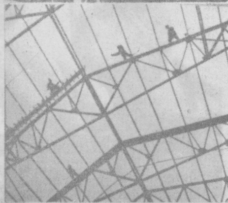
ЕГО ВЕЛИЧЕСТВО РАБОЧИЙ КЛАСС (на серии) — М. КОМЛЕВ. ГЕОМЕТРИЯ СОЗИДАНИЯ — Н. КЛЮЧЕВ. (Республиканская выставка художественной и документальной фотографии).