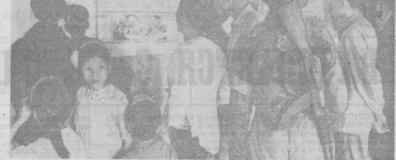
ДРВ. У одного из стендов в книжном магазине Ханоя. Наряду с исполненными в традиционном стиле пейзажами на книжных базарах продаются картины и рисунки, рассказывающие о сегодняшнем дне Вьетнама, его труде и борьбе.

Несмотря на обещание США вернуть в 1972 году административные