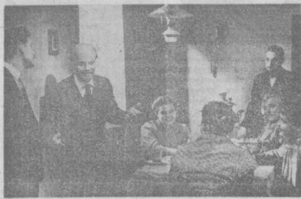
НА СНИМКЕ: кадр из кинофильма «Сердце матери».

Владимир Ильич всегда придавал большое значение работе кино и с удовольствием просматривал новые революционные фильмы. В последние месяцы его жизни в доме был заведен до-машний кинематограф и сеансы устраивались чуть ли не каждый день. Из последних картин, показанных Владимиру Ильичу, он с особым удовольствием смотрел постановку «Чудотворец» и т. п. и отговаривался от комических побасенок американского изготовления. М. И. УЛЬЯНОВА.