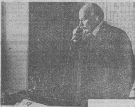
НА СНИМКЕ: кадр из кинофильма «Шестое июля».