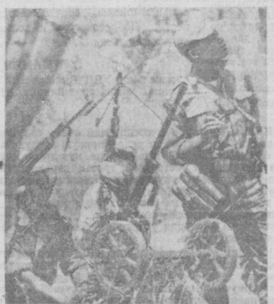
Фронт, освобождения Мозамбика (ФРЕЛИМО) создал хорошо организованные воинские части, которые успешно ведут боевые операции против португальских колонизаторов.

ПРАГА. Свыше 235.000 тонн продукции поставят в нынешнем году социалистическим странам новый металлургический комбинат имени Клементы Готвальды в Остраве-Кучинах (пригород Оставы). Это почти на 50 тысяч тонн больше, чем предусматривалось планом. Комбинат отгрузит в Советский Союз большую партию труб для нефтепроводов, в Болгарию и Румынию — домеханические, в Хайну несколько тысяч тонн стальных труб, необходимых для восстановления электростанций.