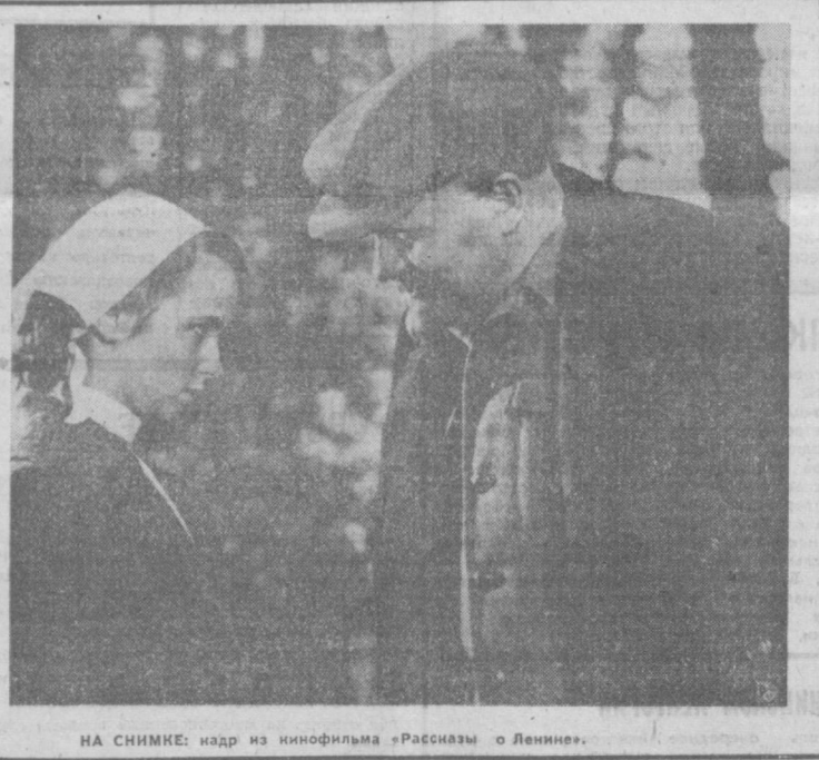
НА СНИМКЕ: кадр из кинофильма «Рассказы о Ленине».