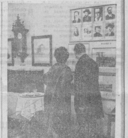
Финляндия. Музей В. И. Ленина в Тампере — одна из достопримечательностей города. Экспонаты музея размещены в здании, где в 1905 и 1906 годах проходили партийные конференции РСДРП.

Празднование 100-летия со дня рождения Ленина, отмечает газета, дает нам основание вспомнить бессмертные дела основателя первого в мире социалистического государства. Рабочие, крестьяне и все прогрессивные люди хранят в своих сердцах величайшее уважение и искреннюю любовь к другу и учителю народных масс — В. И. Ленину, заключает «Аль-Фажд».