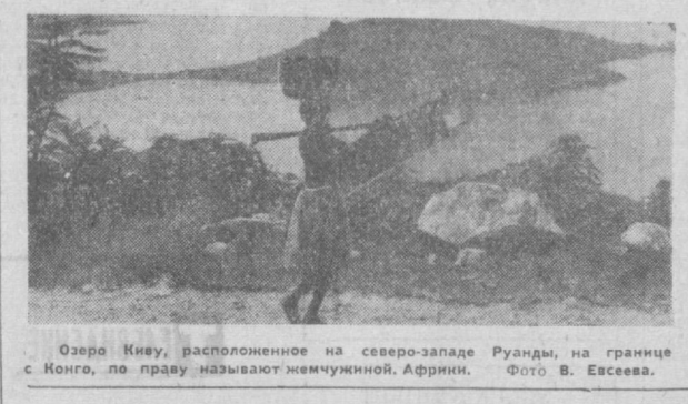
Озеро Киву, расположенное на северо-западе Руанды, на границе с Конго, по праву называют жемчужиной Африки.

НЬ-ЙОРК. Национальная конференция «Новой демократической коалиции», проходившая в Чикаго, закончила работу принятым призывом усилить борьбу против войны во Вьетнаме и реакции внутри страны. На конференции присутствовали 466 делегатов из 28 штатов, представляющих клубы демократической партии, профсоюзы, объединенные борцы за гражданские права и организации, выступающие за мир. Выступая на конференции, С. Готлиб, исполнительный директор «Организации граждан за разумный мир», подчеркнул решимость участников конференции усилить борьбу против вьетнамской войны и милитаризации американской экономики. Оратор призвал всех миролюбивых американцев провести 15 апреля массовые демонстрации по всей стране против войны и милитаризма — именно в тот день, когда должны быть выплачены налоги. После конференции делегаты прошли колонной по улицам Чикаго к зданию федерального суда с тем, чтобы выразить свой протест против жестоких приговоров, вынесенных 7 активным борцам против вьетнамской войны и расовой дискриминации.