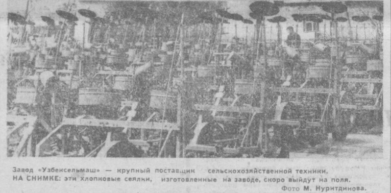
Завод «Узбелсельмаш» — крупный поставщик сельскохозяйственной техники. НА СНИМКЕ: эти хлопковые сеялки, изготовленные на заводе, скоро выйдут на поля.

Социологи доказали, что увольнение можно резко сократить. Ведь в постоянных кадрах кроется мощный резерв роста производительности труда. Коллективный корреспондент «Вечернего Ташкента» — редакция газеты «Тракторостроитель».