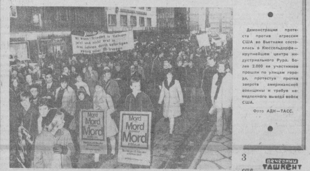
Демонстрация протеста против агрессии США во Вьетнаме состоялась в Кюссельдорфе — крупнейшем центре индустриального Рура. Более 2000 ее участников прошли по улицам города, протестуя против зверств американской военизации и требуя немедленного вывода войск США.

лургический завод Абу-За-поставленного ему вопроса, чтобы дать должный отпор авантюристической политике Ираэля требует срочного правительства обсуждения в парламенте и обязать его выполнить решение Совета Безопасности ООН от 22 ноября 1967 года для обеспечения справедливого и длительного мира на Ближнем Востоке.