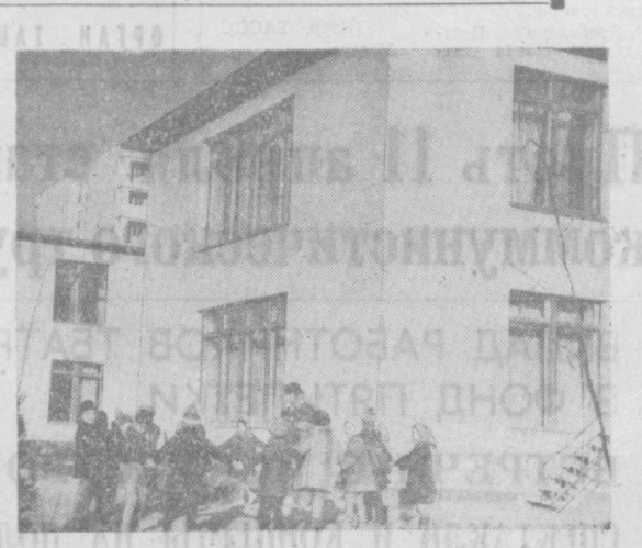
Чудесный подарок нашим малышам преподнесли недавно краснодарские строители — детский сад на 280 мест. Это просторное здание с летними верандами, игровыми комнатами, столовыми. Во дворе целый спортивный городок, затейливые беседки, аттракционы. НА СНИМКЕ: юные ташкентцы в своем детском саду, что в Ч-4.

Алмашлынского химзавода. С помощью наших управлений построено для села много жилых домов с общей площадью 370.832 квадратных метра. Большое внимание монтажники уделяют внедрению новой техники, механизации и прогрессивным методам труда. Почти во всех управлениях введены сетевые графики, комплектация оборудования. Благодаря внедрению рационализаторских предложений коллектив сумел за прошлый год сэкономить около 240 тысяч рублей.