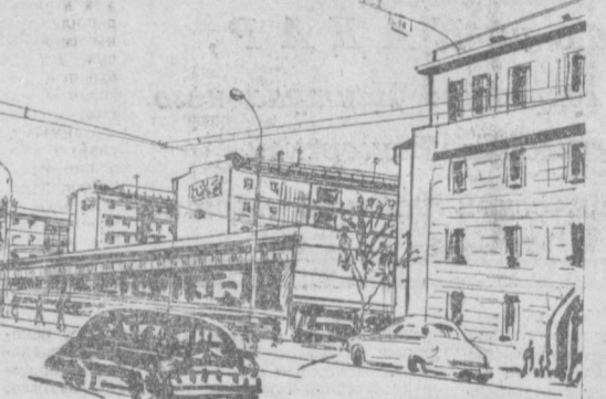
А это — новая улица Усмана Юсупова... Ровная широкая магистраль, дома из кирпича и железобетона, дороги и тротуары, одеяние в асфальт, новые благоустроенные квартиры с водопроводом, газом, телефоном, всеми удобствами — таков новый Ташкент. Рис. Н. Меламед.