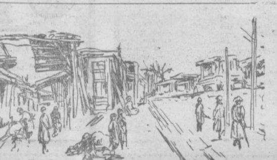
Это — уголок старого Ташкента. Дороги, тротуары, дувалы, кибитки — все из глины. Вода — из арки. Санитарные условия крайне трудно. Дома без печей, люди спят на земле. Таковы условия, в которых жил трудовой люд...