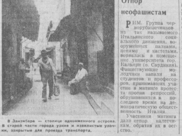
В Занзибаре — столице одноименного острова. В старой части города узкие и извилистые улочки, закрытые для проезда транспорта.

ХАРТУМ. Инициативный комитет, представляющий различные слои суданского народа, обратился с призывом и соотечественникам принять активное участие в праздновании столетия со дня рождения В. И. Ленина. Весь простым людям дорога память о вожде социалистической революции, говорится в воззвании. Это был мыслитель, теоретик и практик, чья энергия и усилия ускорили революцию в России. Его любят и помнят не только в Советском Сою-