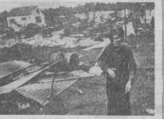
Шестой год продолжается агрессия США во Вьетнаме, унесшая тысячи человеческих жизней и разрушившая сотни городов, сел и деревень. НА СНИМКЕ: развалины мирной южной вьетнамской деревни, разрушенной американской авиацией.

НЬЮ-ЙОРК. Несмотря на все репрессии, в США продолжается кампания протеста против позорного вынесения чикагским федеральным судом семи активистам антивоенного движения. В Чикаго более трех тысяч человек устроили демонстрацию протеста против неадекватности над правосудием. Собравшись неподалеку от здания тюрьмы, где находятся осужденные, участники манифестации потребовали немедленного пересмотра «дела» сфабрикованного полицейскими властями. Демонстрация, митинги и собрания, участники которых выразили протест против расправы над «чикагской семеркой» и их адвокатами, состоялись также в Лос-Анджелесе, Милуоки, Кливленде, Майами и ряде других городов страны.