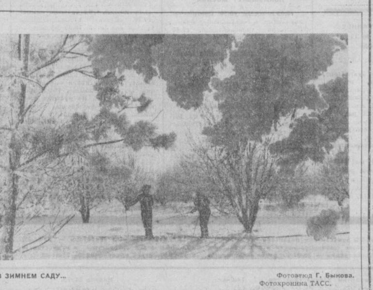
В ЗИМНЕМ САДУ...