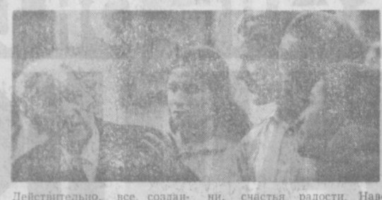
Действительно, все, созданное замечательным и самобытным живописцем, проникнуто ни, счастья, радости. Наверное, поэтому его полотна, окрашенные буйством красок, чини, радости, радости. Наверное, поэтому его полотна, окрашенные буйством красок, чини, радости, радости.

Мартироса Сарьяна — любящий к Родине, искренним восхищением людьми, украинскими и преобразующими свой край, прославленным живописцем.