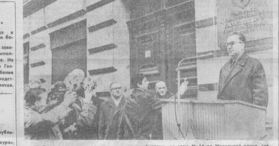
В Праге состоялось открытие мемориальной доски, на доме № 14 по Жезницкой улице, где в январе 1912 года во время работы VI (Пражской) конференции РСДРП жил В. И. Ленин. На торжественной церемонии присутствовали представители КПЧ, местных властей и общественности столицы. НА СНИМКЕ: во время торжественного открытия мемориальной доски.

А ДЕН. Два советских судна доставили в Аденинский порт машины и оборудование для строительства в Народной Республике Южного Йемена восьми ирригационных плотин. Оборудование поставлено в соответствии с заключенным между СССР и НРЮЙ соглашением о со-