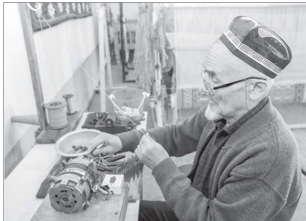
Корхонаи «Ёдгорлик»-и ба истеҳсоли махсусоти абрешим иқтисосонидаи шаҳри Марғелон соли 1924 дар шакли ателе ташкил гардида, санитар бо номи «Хон атлас» махсусоти худро ба бозор баровардааст. Корхонаи мазкур дар самти сайёҳи соли 1991 аз ҷониби ташкилоти байналхалқии ЮНЕСКО ба эътирофи алоҳида сазовор гардидааст. Алҳол дар корхона 40 нафар хунарманди моҳир фаъолият мегардад. Ин ҷо давоми сол ба ҳисоби миёна 10 ҳазор сайёҳ таширф оварда, аз намунаҳои санъати миллии хунармандӣ баҳраманд мешаванд. Дар сурат: дар корхонаи «Ёдгорлик».