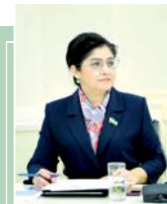
Malika QODIRXONOVA, senator