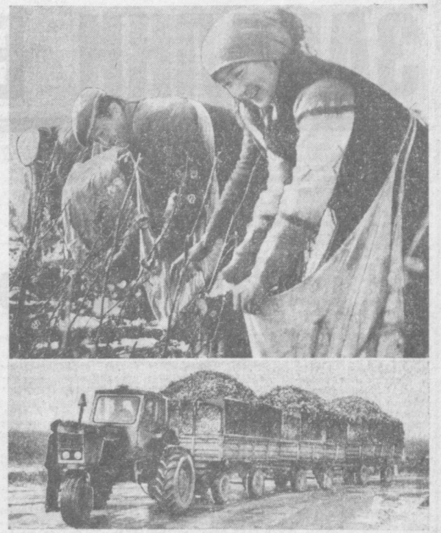
НА СНИМКАХ сверху: студенты первого лечебного факультета ТашМИ собирают хлопок на полях совхоза «Самарканд»; тракторный поезд с хлопком, собранным студентами ТашМИ.

В этой битве активно участвуют посланцы столицы республики. «Соберем весь урожай, до последней коробочки», — заявляют молодые ташкентцы.