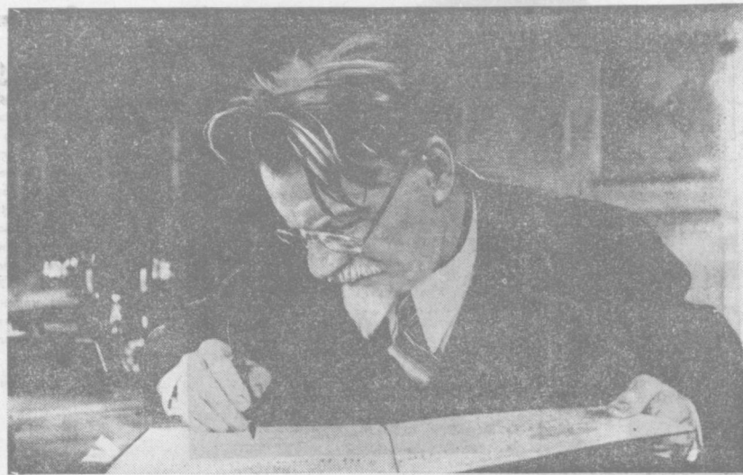
Председатель Президиума Верховного Совета СССР М. И. Калинин в своем рабочем кабинете в Кремле. 1939 год.

новления дружеских советско-американских отношений проработала себе дорогу. Осенью 1933 года президент США Франклин Рузвельт предложил Советскому правительству начать переговоры об установлении дипломатических отношений. Это предложение получило поддержку Советского правительства. В ответном послании президенту США М. И. Калинин писал: «Я всегда считал крайне ненормальным и достойным сожаления существование в течение шестнадцатилет полуживые, при котором две великие республики — Союз ССР и Соединенные Штаты Америки — не имеют обычных методов сношений и лишаются тех выгод, которые эти сношения могли бы нам дать. Я рад отметить, что и Вы пришли к такому заключению...» «Великие люди принадлежат не только истории. Они в рядах современников, примером своей жизни, своим идеями помогают живущим в их борьбе за высокие идеалы. К их числу принадлежит и Михаил Иванович Калинин». Анатолий ТОЛМАЧЕВ, (АПН).