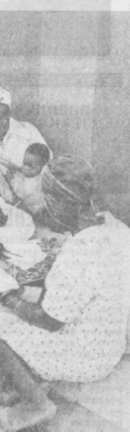
На карте Африки появилось новое независимое государство — Народная Республика Ангола. На курсах лингвиста, создаваемых МПЛА (Народное движение за освобождение Анголы), участв сейчас около 150 человек. Независимость Анголы будет провозглашена в ближайшие дни.