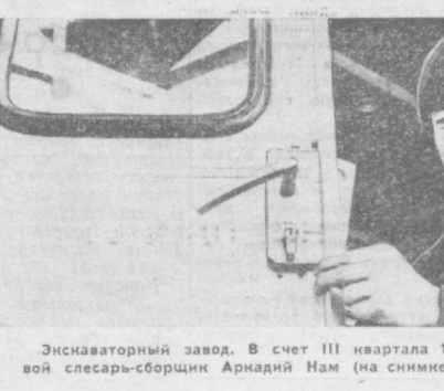
Экскаваторный завод. В счет III квартала 1976 года трудится передовой слесарь-сборщик Арнайд Нам (на снимке).

Хорошее предложение внесено автомотористами — членами первичной организации № 2 Ленинского района, которые предлагают построить в квартале С-7 подземный гараж на 200—300 автомобилей под стадионной школы № 110.