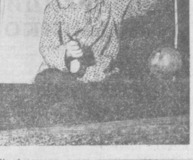
На фестивале народного искусства в Ханое пятилетний житель столицы ДРВ Там был удостоен золотой медали за исполнение народных мелодий на старинном однострунном инструменте (на снимке).

Коллектив предприятия по праву гордится своими успехами. Говоря о достижениях завода, каждый рабочий добавит, что большую роль в создании и развитии мощной энергетической промышленности сыграл Советский Союз, и в первую очередь Ленинградский металлургический завод.